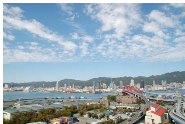
貸室からの眺望。ビルの北側には神戸港から市街地、さらに六甲連山が広がる