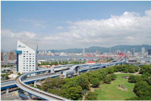
ポートライナー「中公園」駅と3階で直結