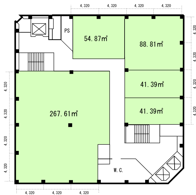
■ 4階～11階貸室 標準間仕切 494.07m 2