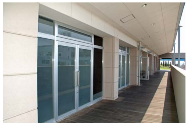
3階貸室前の通路。暖かみのあるウッドデッキ仕上げ